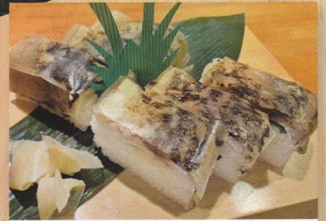
炙りメ鯖バッテラ 1,100円